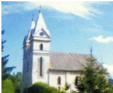
Kostol Sv. Juraja