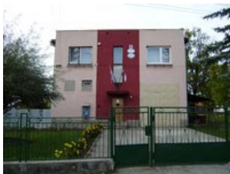
Budova obecného úradu