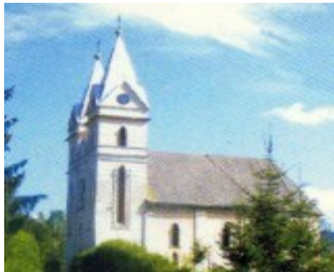
Kostol Sv. Juraja