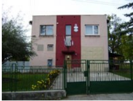
Budova obecného úradu